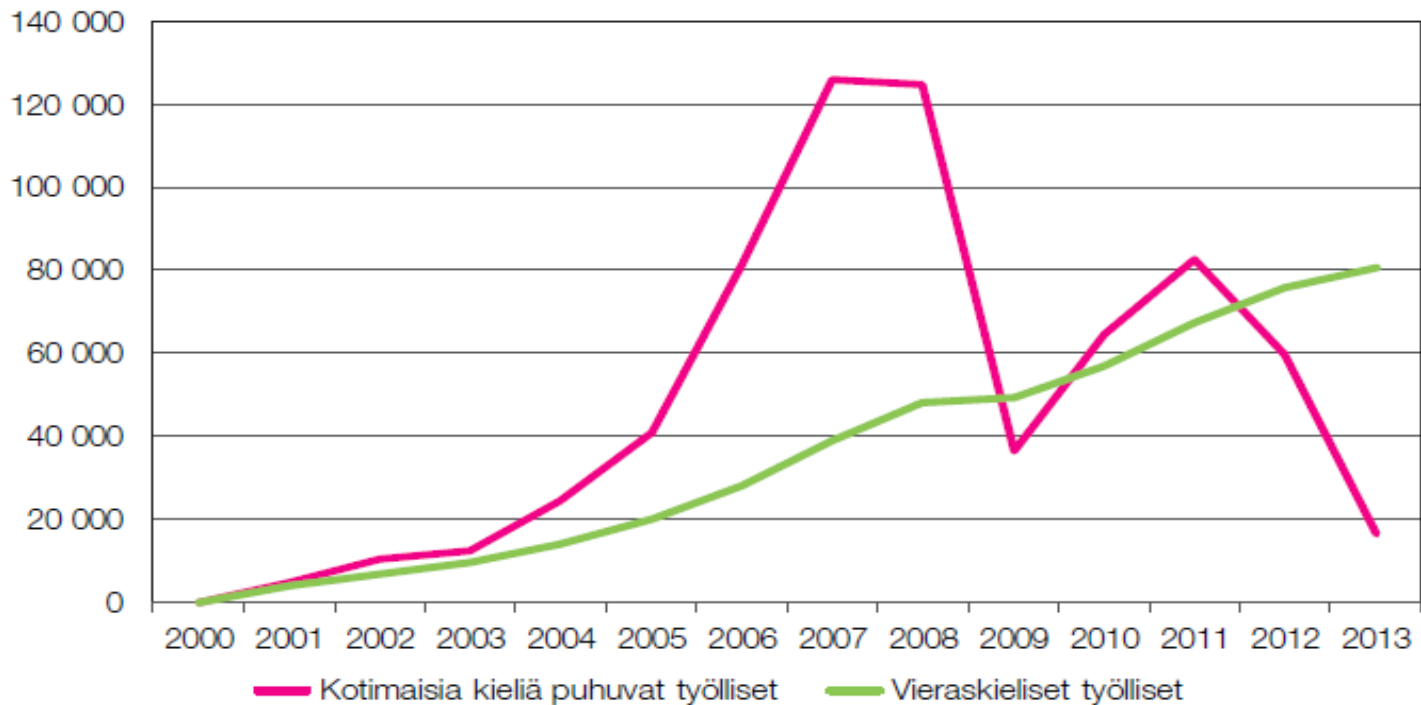
Kuva 2b. Maahanmuuttajien ja kantaväestön työllisten määrän muutos 2000–2013, 1000 henkilöä (2000=0). (Lähde: Myrskylä & Pyykkönen 2015.)